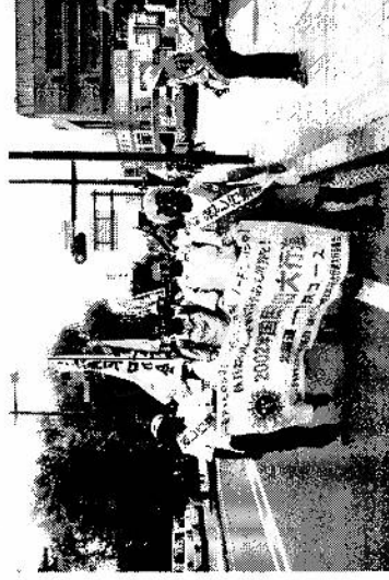
亀城公園を出発する行進団

日本原水協主催の原水爆禁止世界大会広島大会は8月4日から6日まで行われますが、現在参加者募集中です。参加費用カンパの都合もあるので、早めに申し出てください。出発は東京駅発4日朝8時20分です。