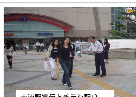
土浦駅宣伝とチラシ配り