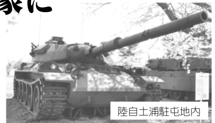
陸自土浦駐屯地内