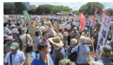
【さよなら原発集会10万人の声！】