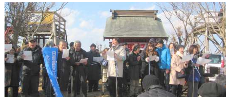
* 東京平和委員会の皆さん：「『花は咲く』を百里で歌いあげます。（大型バスで約50人が参加）」