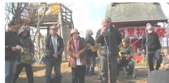
* 栃木平和委員会「毎年参加してます。」