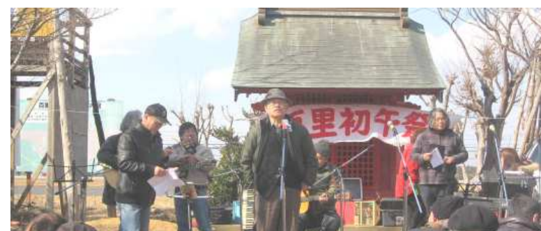
* 埼玉・狭山平和委員会代表の挨拶「この後魚市場に行きます。」（大型バスで約45人が参加）」