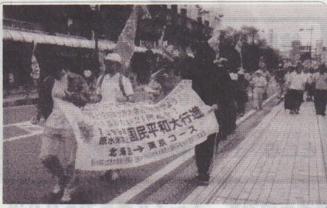
平和行進土浦コース

私は今年はいじめて新婦人の平和専門部を担当することになり、戦争法反対、君が代、日の丸法制化反対運動を通じて否応なしに平和の問題に直面させられています。今まで平和問題を選んできたわけではありません。私は根っからのノンポリで、ただ漫然と毎年母親大会の平和分科会に出席してきました。あまりまじめでない私にも最近の平和運動が曲がり角にきているようにみえます。だいが前は土浦大会でも涙ながらに自分の戦争体験を語ってくれる人々がいて、私達の胸に反戦の熱い思いがひしひしと伝わってきたものです。しかし、最近ではこれらの方々が出ていらいっしょやなくなりました。戦争の語り部達がめっきり少なくなり、今では、私達の年代が戦争の幼児体験を持っているくらいです。五十代の半ば以下の人達は戦争を知りません。戦争で受けた傷跡の痛みと戦争反対の熱い思いが段々とうすらいでいくようです。ほとんど戦争を知らない人達に平和運動をどのように広げ、どのように進めて行ったらいいのか、今問われているように思います。今年の母親大会の分科会ではこのような問題が提起されました。難しい問題ですが、みんなと一緒に知恵を出し合い行動して行きたいと考えています。