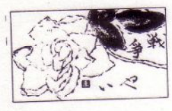
茨城県平和委員会 1999年11月

平和シリーズパンフ NO.3 1冊100円 販売中。希望者は各理事に連絡ください。