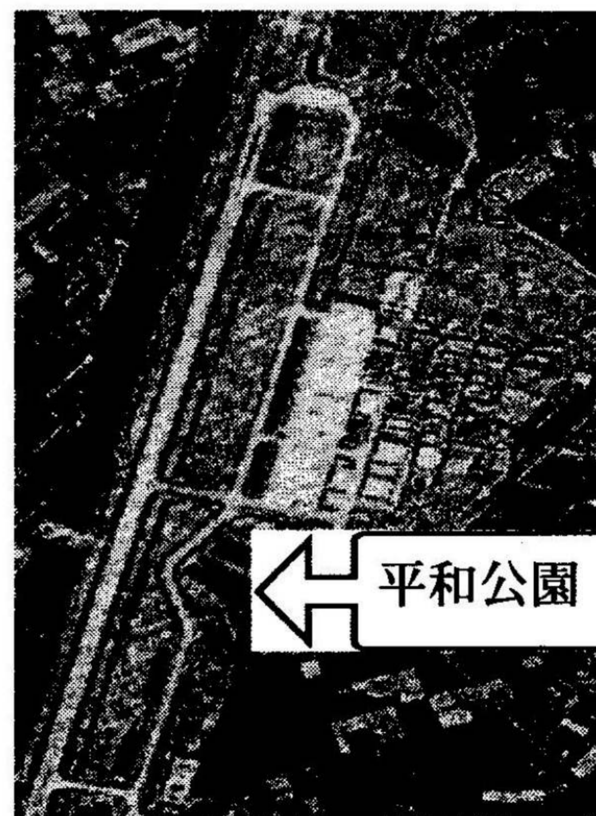
空から見た百里基地

名護市民の住民投票結果を踏みにじって、市長は普天間基地の名護市移転を受け入れてしまいました。15年の期限付き移転はとうていアメリカが受け入れない条件です。このまま強行するなら、名護市民は市長リコールの運動を始めることを確認し、準備が始められています。この運動には、大きな運動費用が必要です。新しいパンフレットもできたので、これを普及しながら連帯のカンパを募る計画です。ご協力よろしくお願いします。